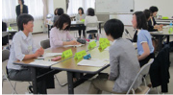
▲ グループワークの様子