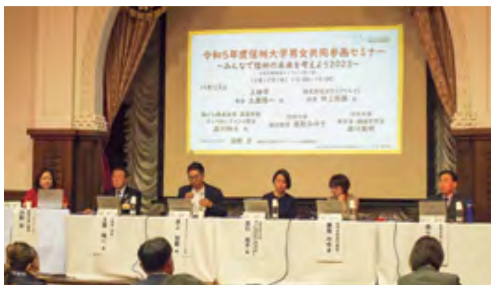
第1部のパネルディスカッションの様子

●詳細については、右記ホームページからご覧ください。 https://www.shinshu-u.ac.jp/danjo/awareness/seminar.php