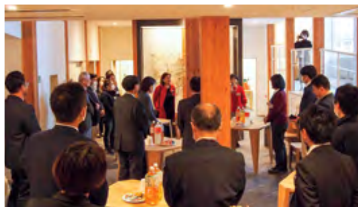
第2部は真綿・蚕糸館で情報交換会を行いました