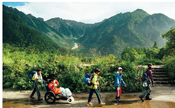
一緒に身体を動かすことを通してつながりを感じる

私は、長野に来てある人たちと出会い、自然の中で遊ぶようになったことをきっかけに、より広い視野を持ち、本質を見抜く事の重要性を実感するようになりました。ぜひみなさんも、信州大学で人生が変わる出会いと学びを深めてください！