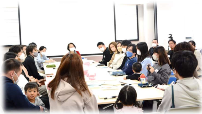
参加者全員で「おしゃべり」している様子