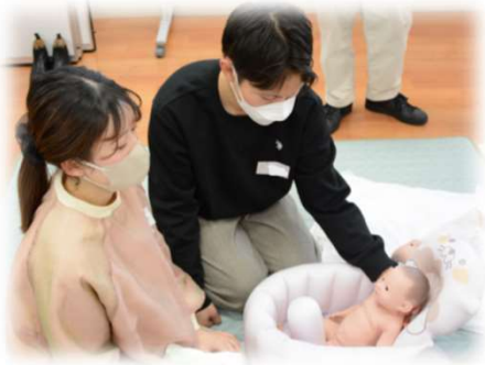
夫婦で赤ちゃん人形を使って 沐浴(お風呂)に入れる演習