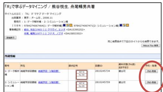
遠いキャンパスにある本でも、「予約・取寄」ボタンで申し込み。

また、情報の表示を見やすくしたり、検索プログラムの改良を行ったりして、本探しがよりスムーズに行えるようになりました。