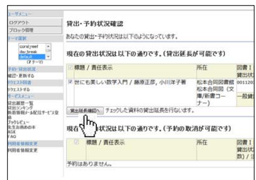
期限内なら図書館に行かなくても Web から貸出延長。