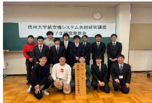
航空機システム共同研究講座 修了生研究発表会M2生、M1生集合 （2024.3.7）