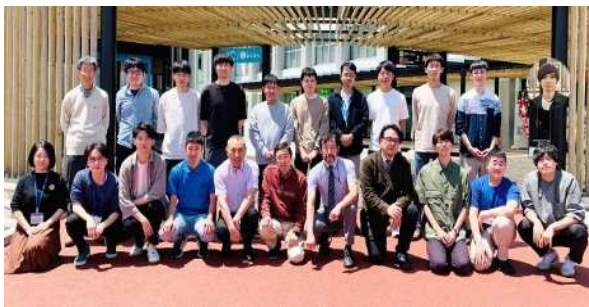
南信州・飯田サテライトキャンパス 学生・教職員（2023.4.1） 航空機システム共同研究講座、大学院工学専攻 航空機システム分野横断ユニット

航空宇宙システム研究拠点 基盤技術部門 専門；磁気工学 主な研究テーマ；航空宇宙機器搭載電源システムの基盤技術開発、航空機搭載用モータの開発、他